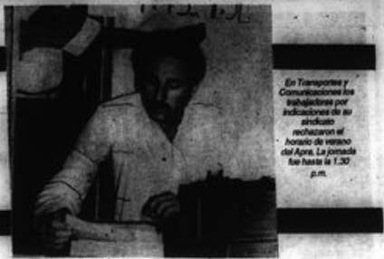
En Transportes y Comunicaciones los trabajadores por indicaciones de su sindicato rehusaron el horario de verano del Apra. La jornada fue hasta las 1.30 p.m.