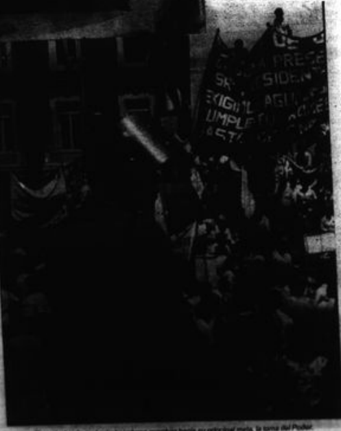
En su lucha diaria, los trabajadores marchan hacia su principal meta, la tierra del Poder.

¡BAJO EL ESTADO TERRATENIENTE-BUROCRAICO! ¡POR LA REPUBLICA POPULAR DE NUEVA DEMOCRACIA! ¡VIVA LA REVOLUCION PERUANA!