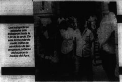
Los trabajadores estatales sólo trabajaron hasta las 1.30 de la tarde. De esta forma hicieron medio millón de servicios de las empresas públicas rehusaron la medida del Apra.